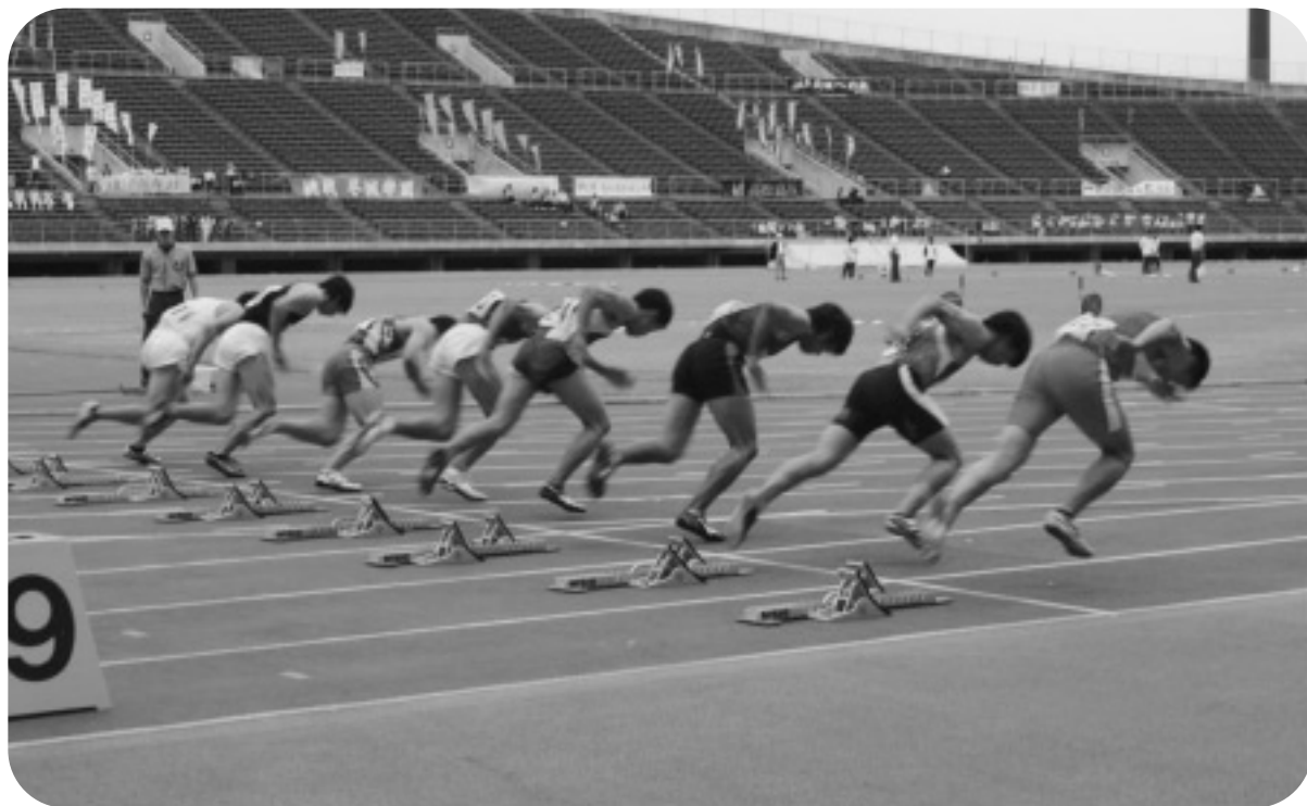
香川県高校総体陸上競技（6月2・3・4日）