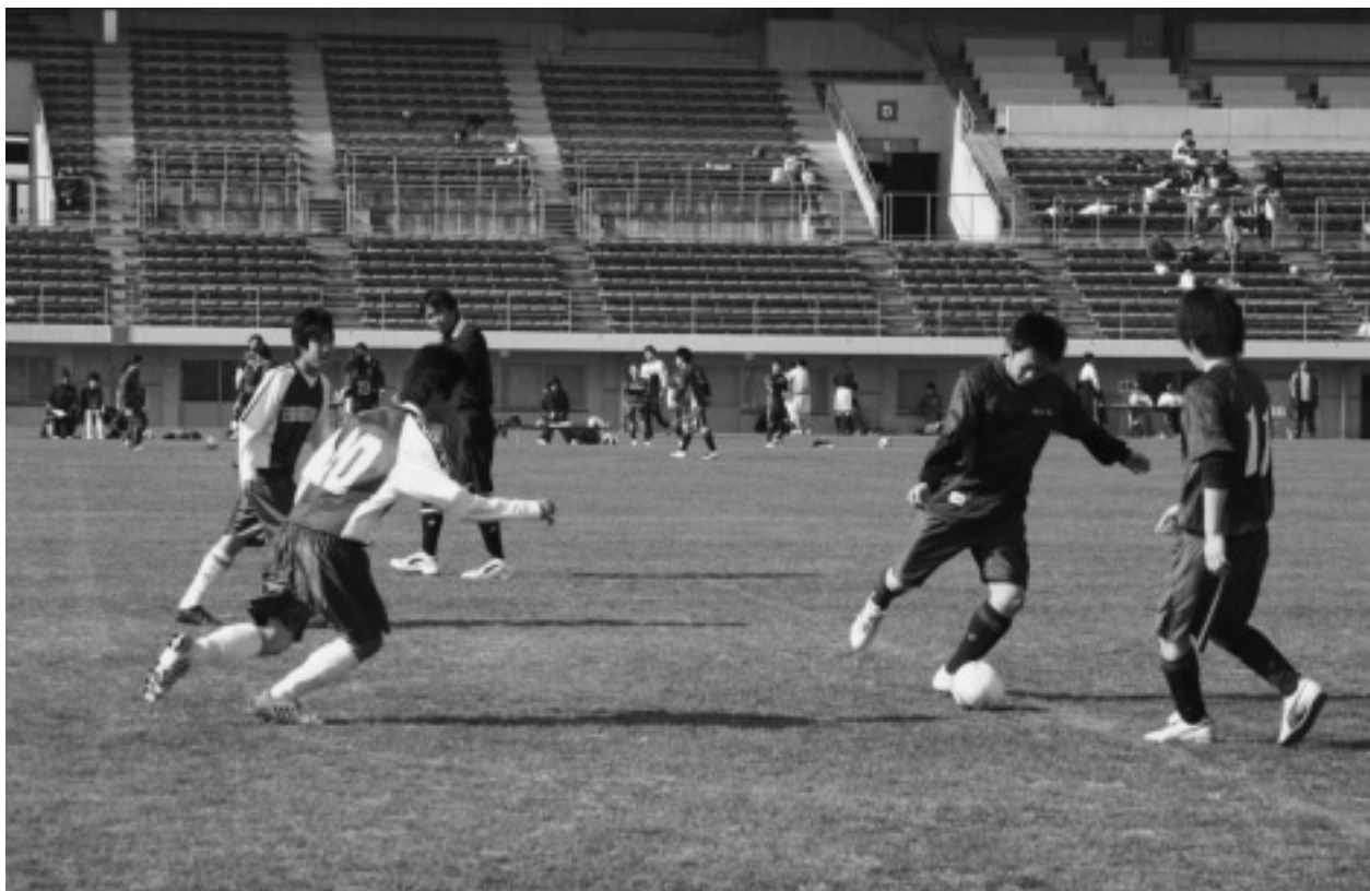
第10回 丸亀競技場フットサル大会（2月11日）