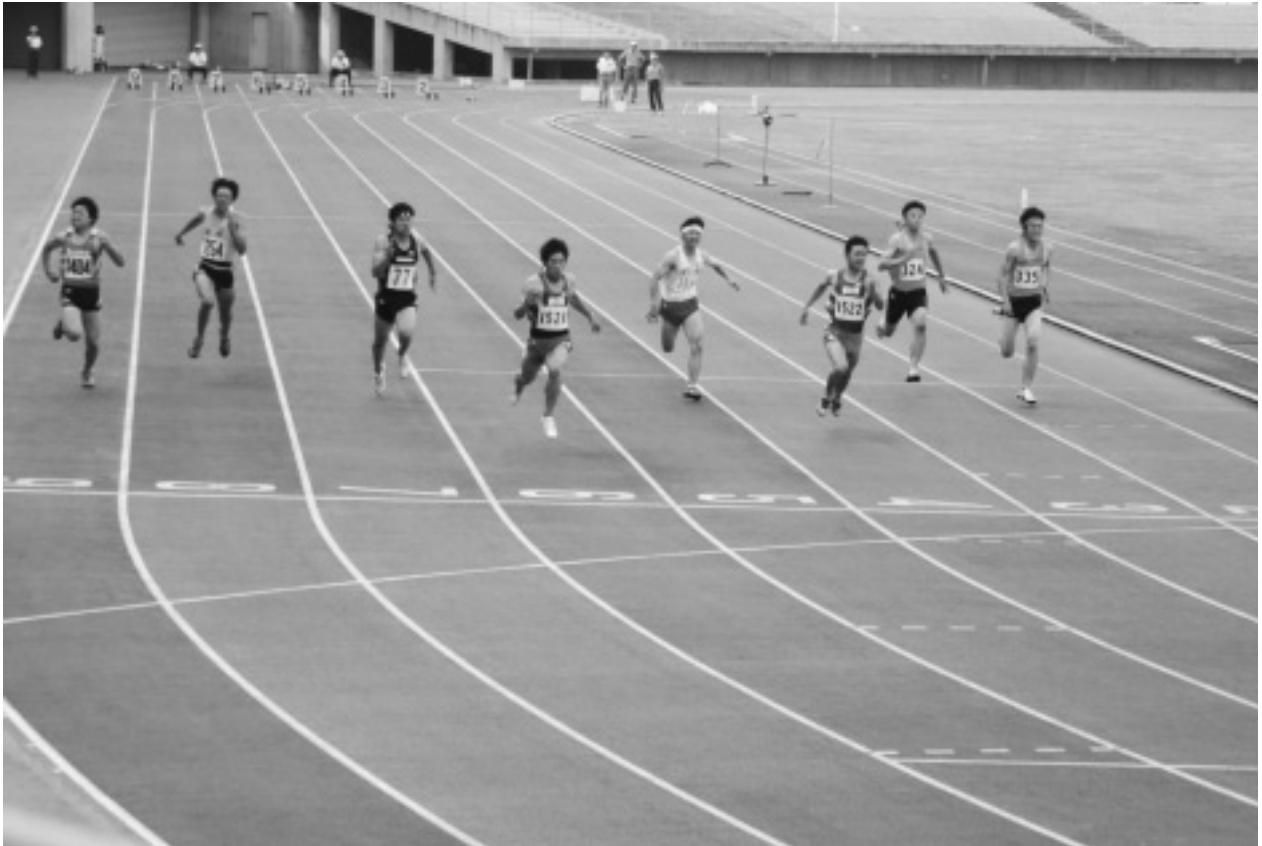
第49回香川県高校総体陸上競技（6月6、7、8日）