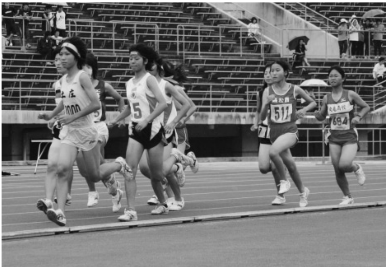
第64回国体陸上競技最終予選会 8月15日(土)、16日(日)