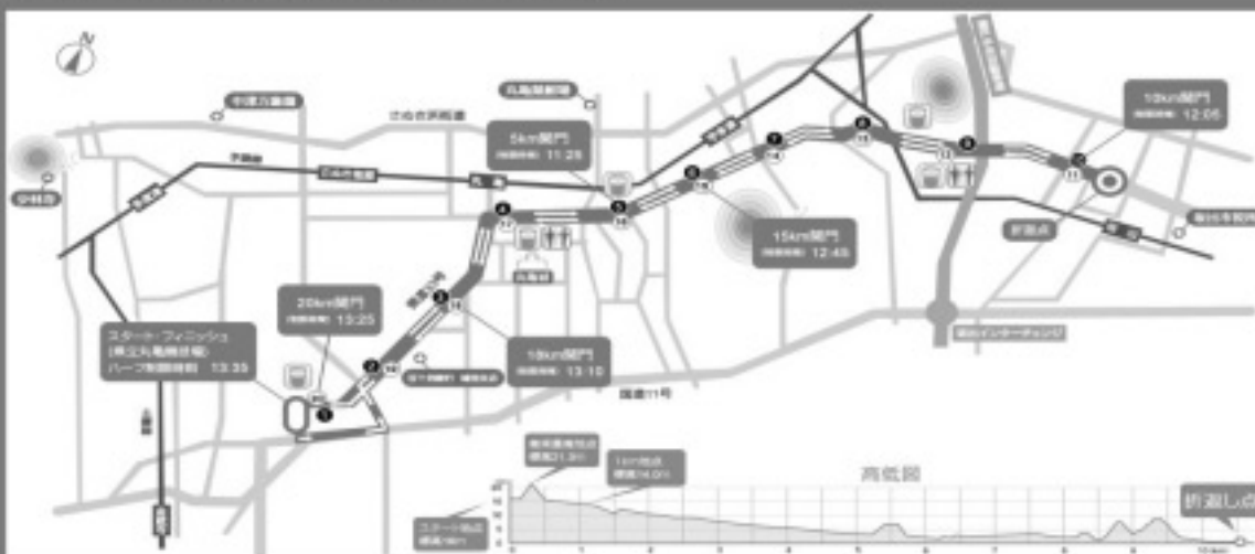
香川丸亀国際ハーフマラソン コース図

※大会前日の2月6日(土) 13:00~17:00県立丸亀競技場にて前日申込みを受付けます。 (保険料含む。各部門とも参加料は、一般5,000円、高校3,000円、小中2,000円となります。) ※丸亀競技場付設駐車場は、駐車券をお持ちの方以外駐車できませんのでご了承ください。 また、観客の方の駐車場はありませんので、JR丸亀駅からの無料シャトルバスなどをご利用ください。 できるだけ公共交通機関をご利用いただくようご協力お願いいたします。