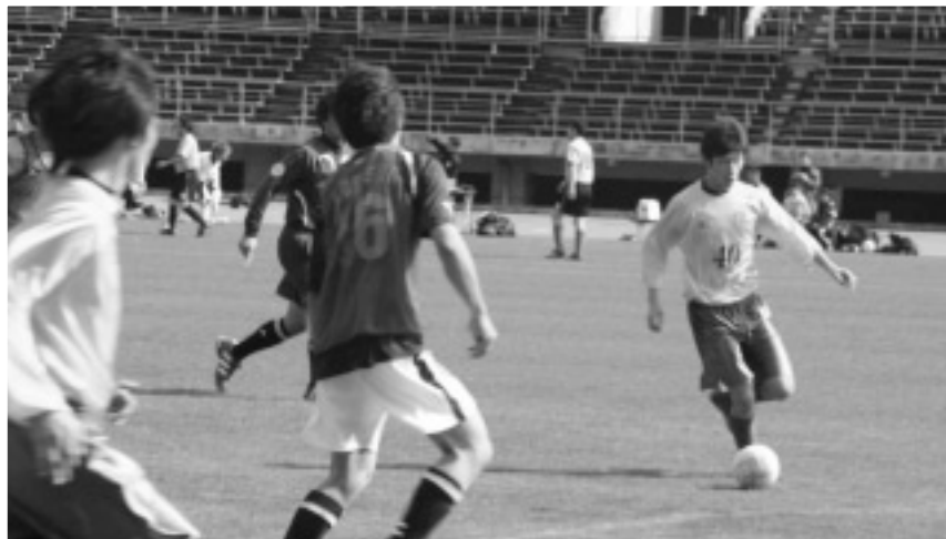
丸亀競技場 フットサル大会