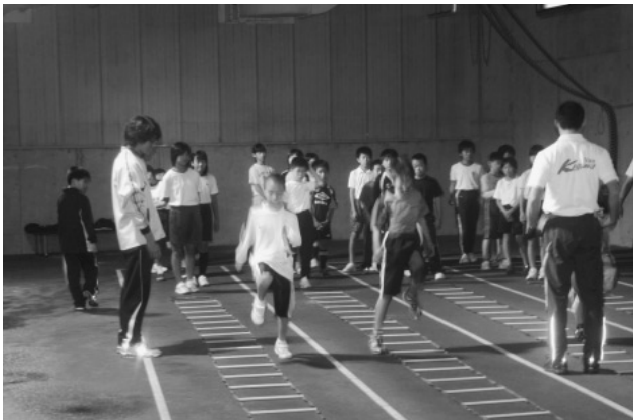
体力向上プログラム 走動作（10月9日）