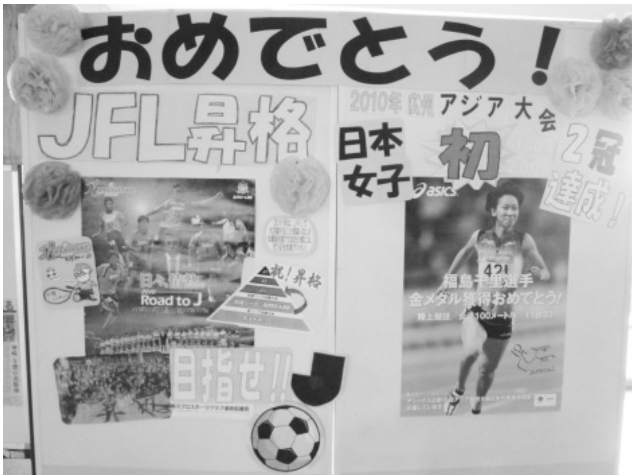
おめでとうボード