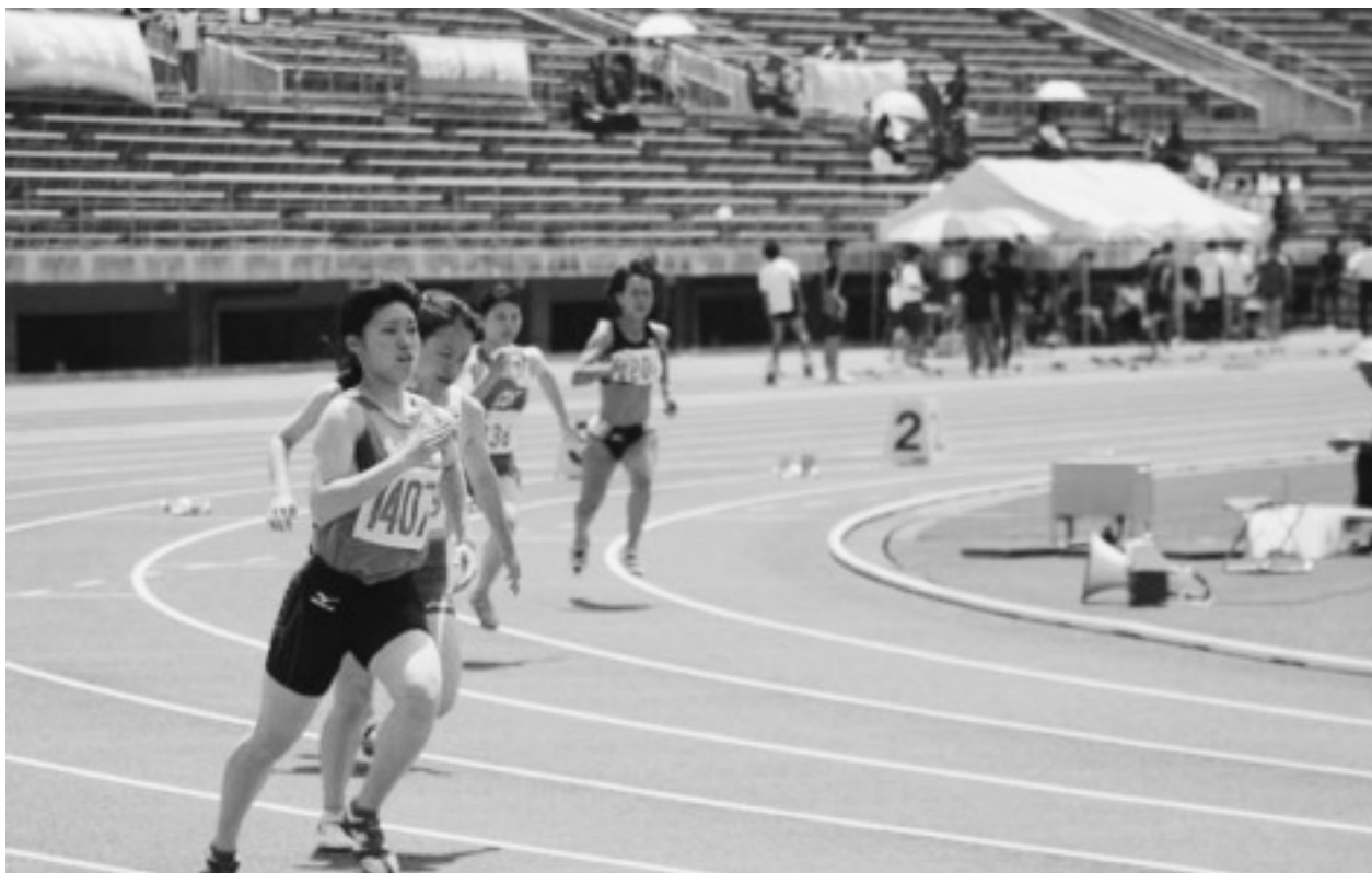
陸上シーズン開幕！（高校記録会）