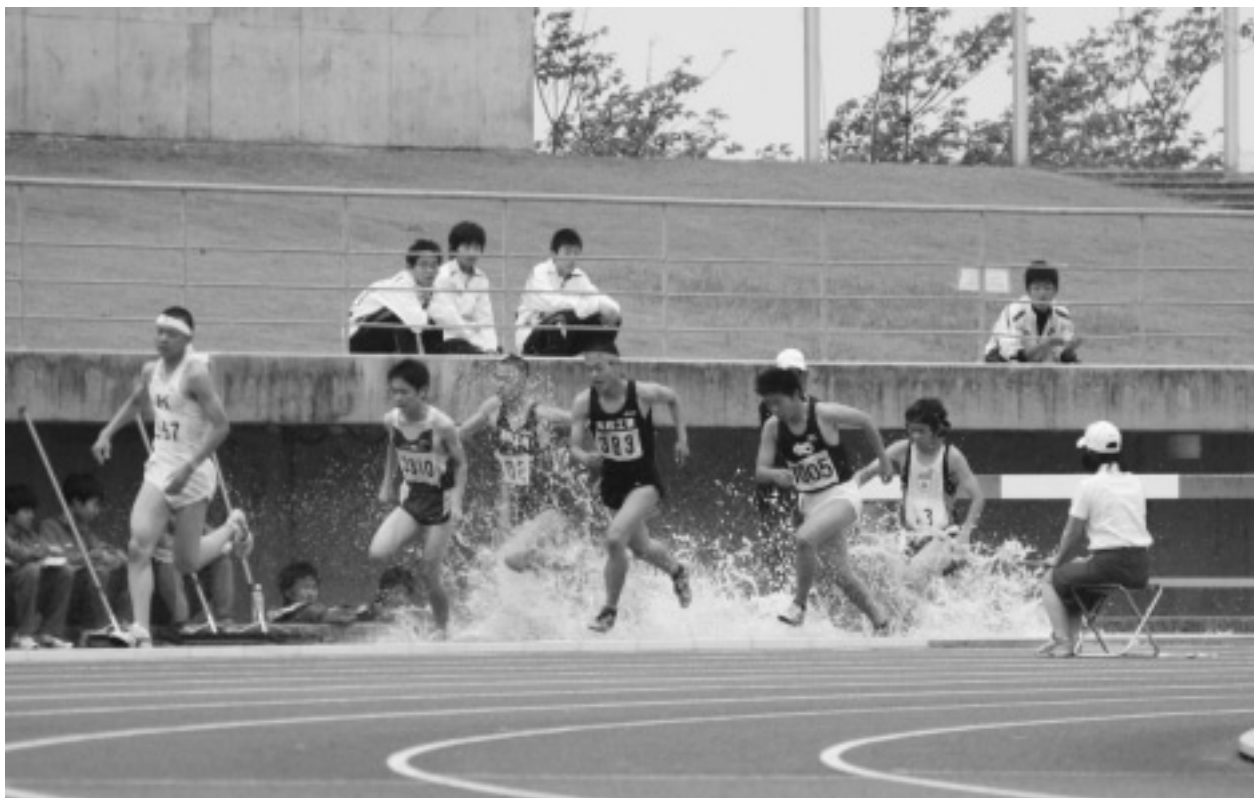
香川県高校総体 陸上競技