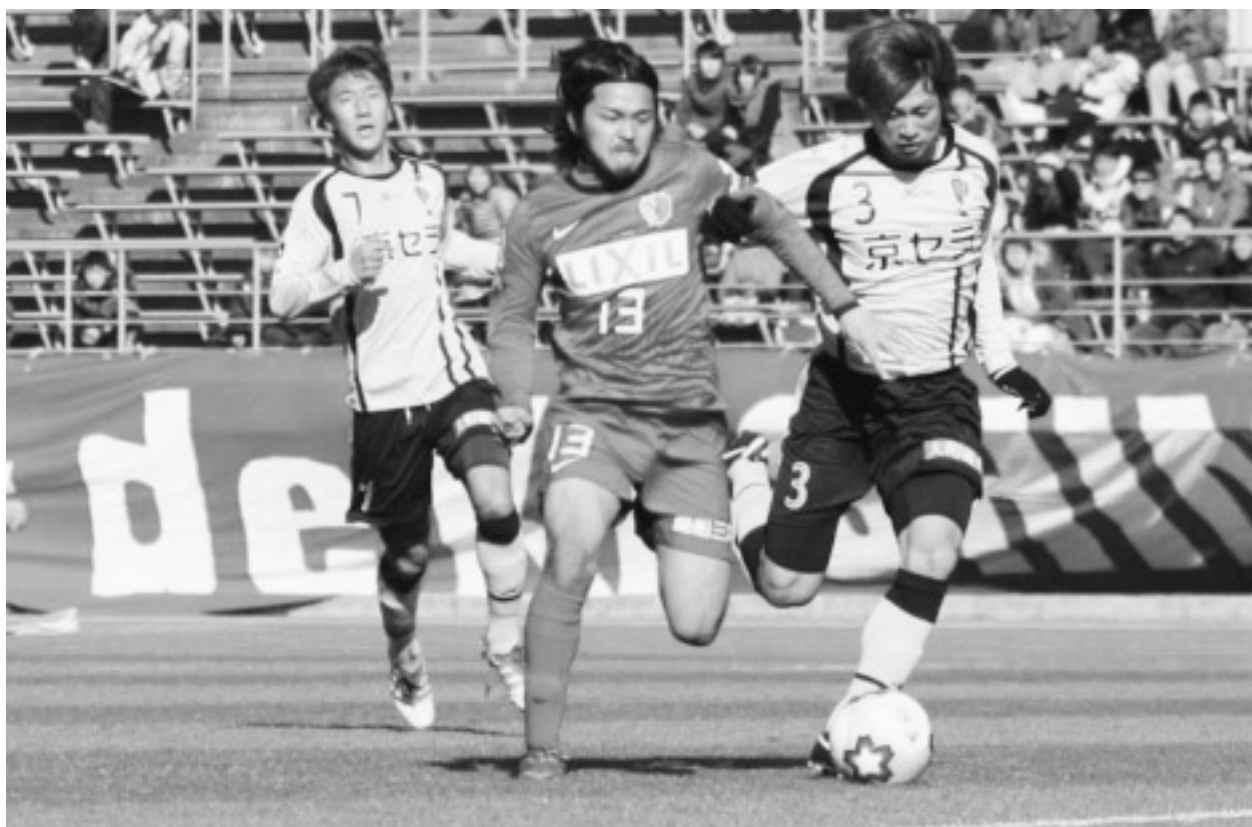
第91回全日本天皇杯サッカー選手権 4回戦 鹿島アントラーズ VS 京都サンガFC