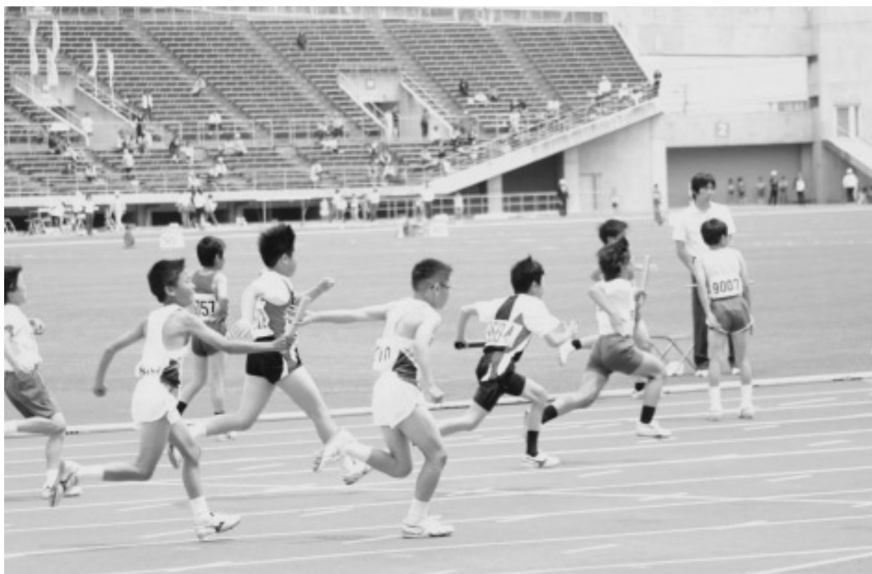
近県陸上競技カーニバル