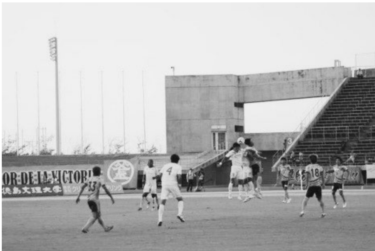
↑ 第23節 FC岐阜戦