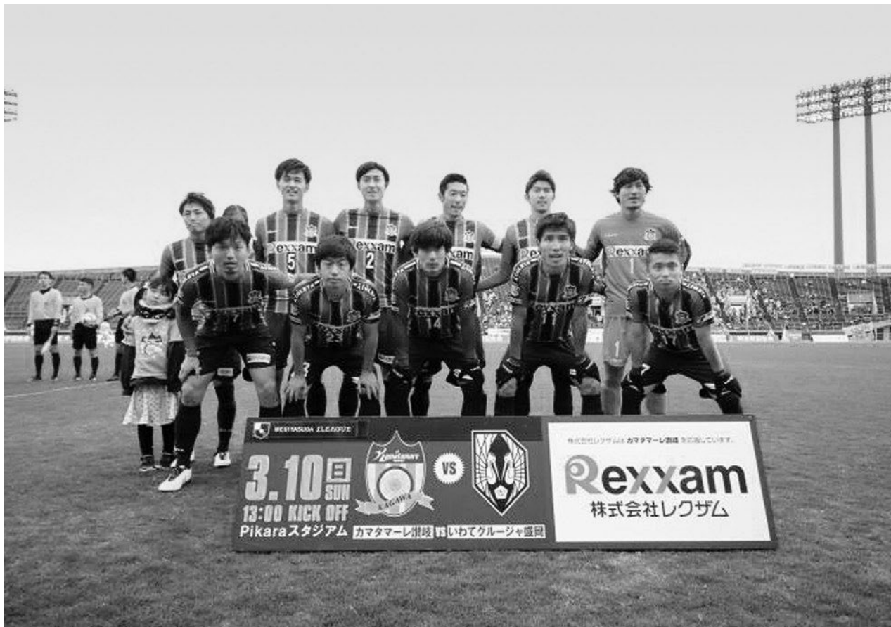
↑ 明治安田生命 J 3 リーグ開幕戦