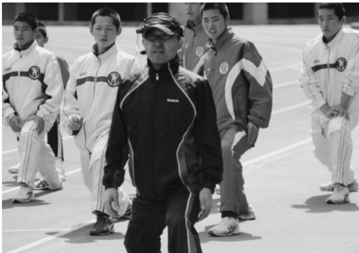
金さんのランニングクリニック（3月15日）