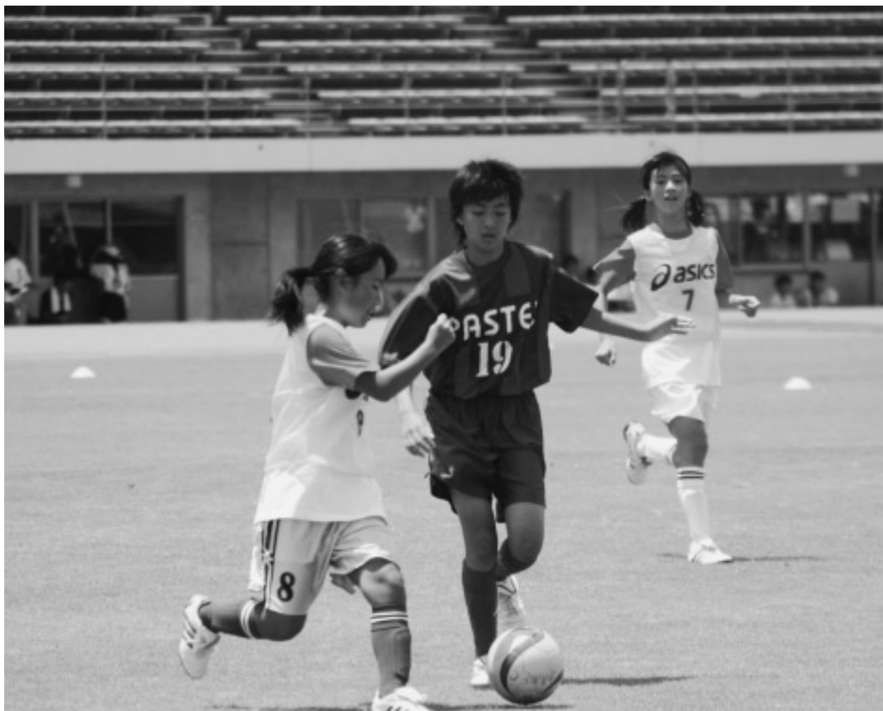
JFAガールズフェスティバル in 丸亀