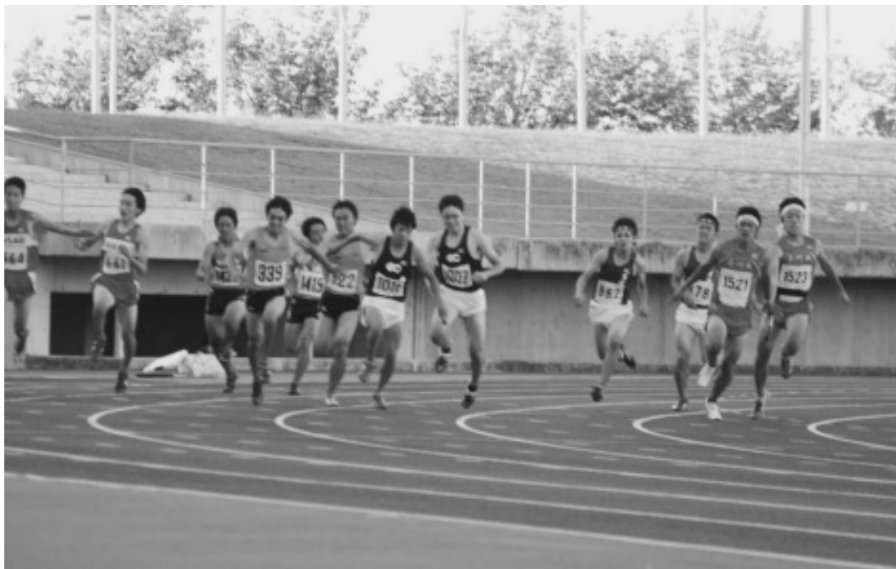
香川県新人陸上記録会