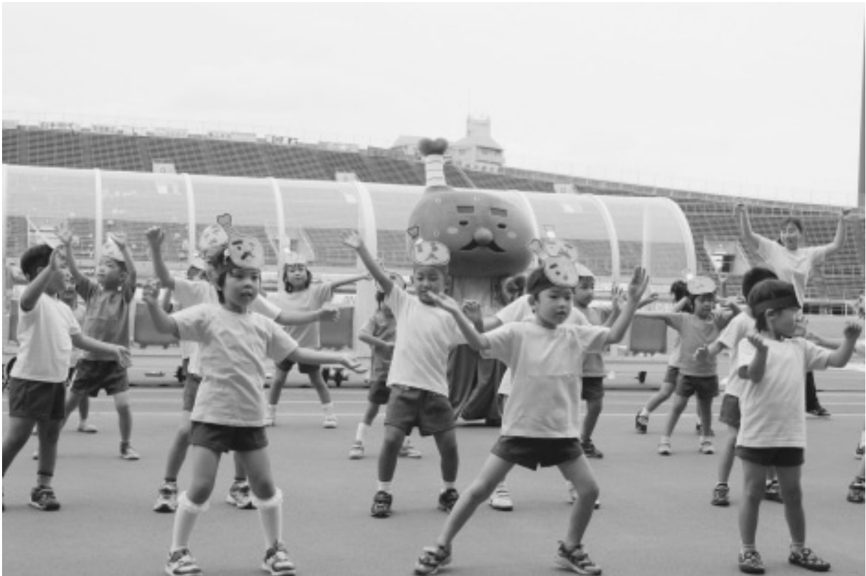
↑カマタマーレ讃岐 vs Y.S.C.C戦のハーフタイムショーの様子