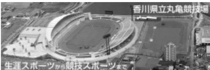
◎丸亀競技場 個人利用料金表(円)◎

第15回日本フットボールリーグ 第14回香川県障害者スポーツ大会 2013ナイトトライアル in 丸亀 丸亀ミニ世界陸上（丸亀競技場主催） 体育の日