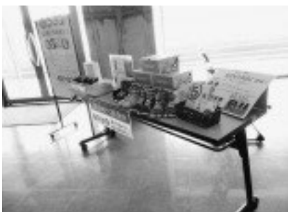
NINATBI & たびりらの試し履き会

5月6日（月・祝）にゴールデンウィークイベントを開催し、たくさんの皆様にご参加いただきました！ありがとうございました。