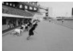
速く走る方法をマスターしよう！