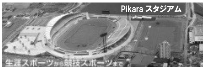
◎Pikaraスタジアム 個人利用料金表(円)◎