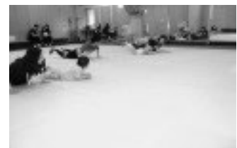
すこやかキッズ体操