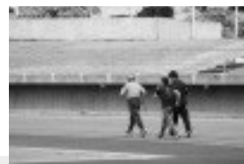
体力測定 & In body測定会