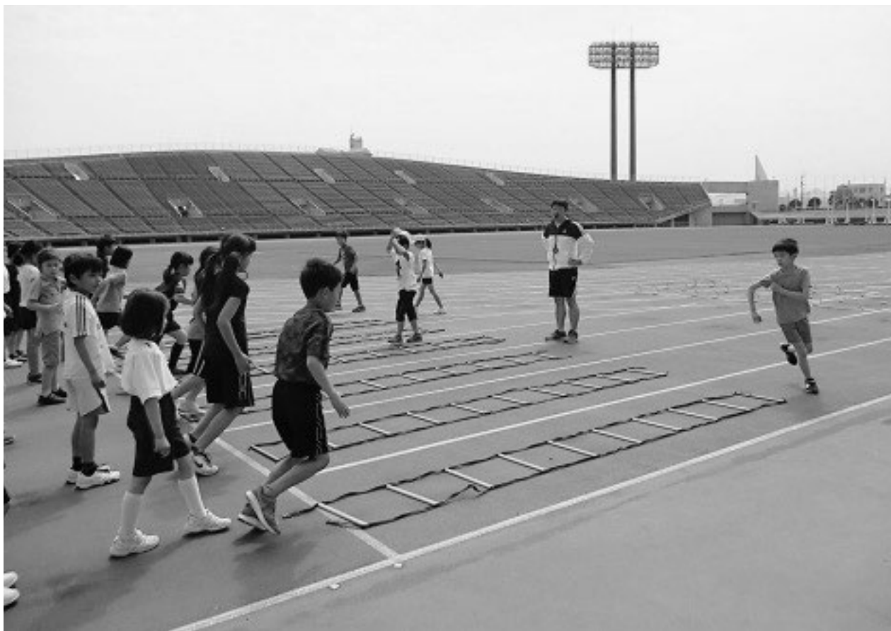
↑ GWイベント 速く走る方法をマスターしよう